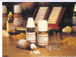
Homöopathische Mittel werden individuell dem Patienten angepasst.

„Ähnliches mit Ähnlichem“ behandeln - eines der Grundprinzipien der Homöopathie. In hoher Konzentration schädlich, stark verdünnt aber hilfreich, können homöopathische Mittel unter anderem Schwermetalle aus ihren Verbindungen im Körper herauslösen und damit einen ersten Schritt zur Entgiftung einleiten. Ihr Arzt wählt, unter Berücksichtigung Ihrer individuellen Situation, ein für Sie geeignetes Einzel- oder Komplexmittel aus.