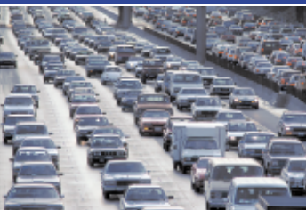
Schadstoffe, Lärm und Stress schwächen unser Immunsystem.

Umweltgifte aller Art haben in den letzten Jahrzehnten verstärkt negativen Einfluss auf unsere Gesundheit und Lebensqualität genommen.