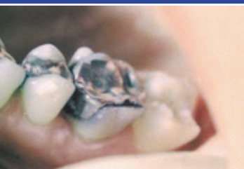
Immer noch haben ca. 90% aller Erwachsenen Amalgam-Füllungen.